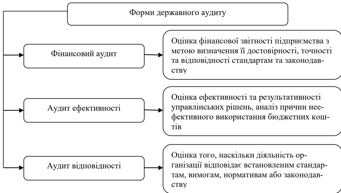
Рис. 1. Форми державного аудиту згідно з класифікацією INTOSAI [3]

Нікіфорова І. зауважує, що метою аудиту ефективності є оцінка ефективності та результативності урядових рішень або показників, а також дотримання принципів економності, ефективності та результативності в організаціях, щодо яких проводиться аудит [8].