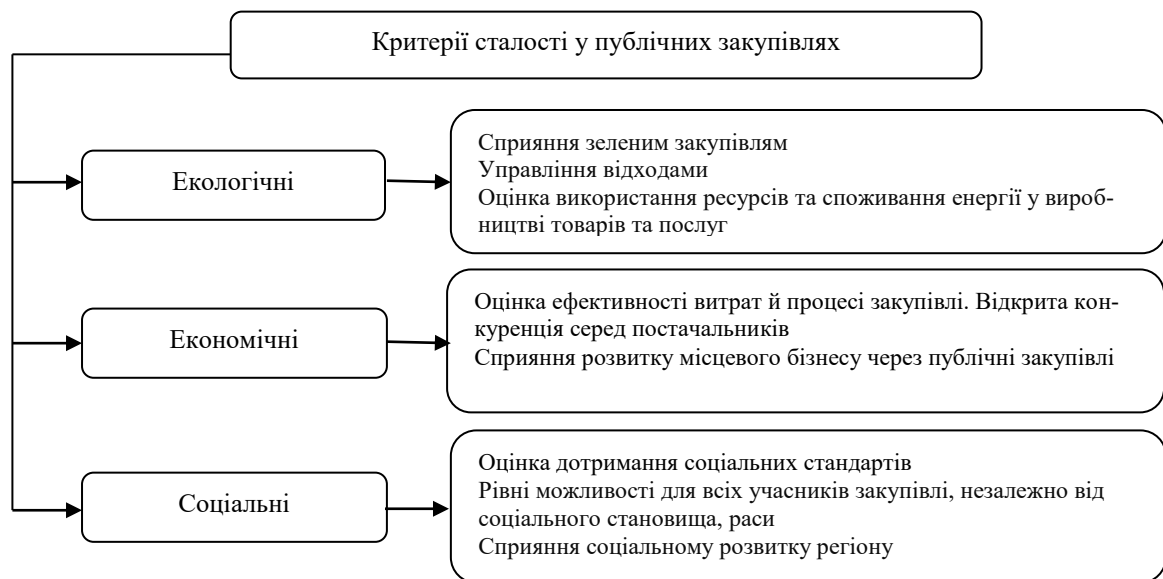
Рис. 3. Аудит ефективності сталих публічних закупівель

Критерії оцінювання товарів та послуг щодо їх сталості під час публічних закупівель є такими (рис. 3).